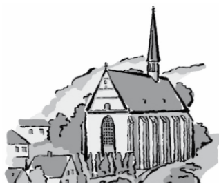
Beyenburger Freiheit 49