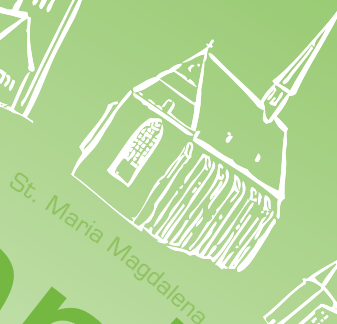
St. Maria Magdalena