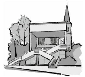
Zu den Erbhöfen 37a